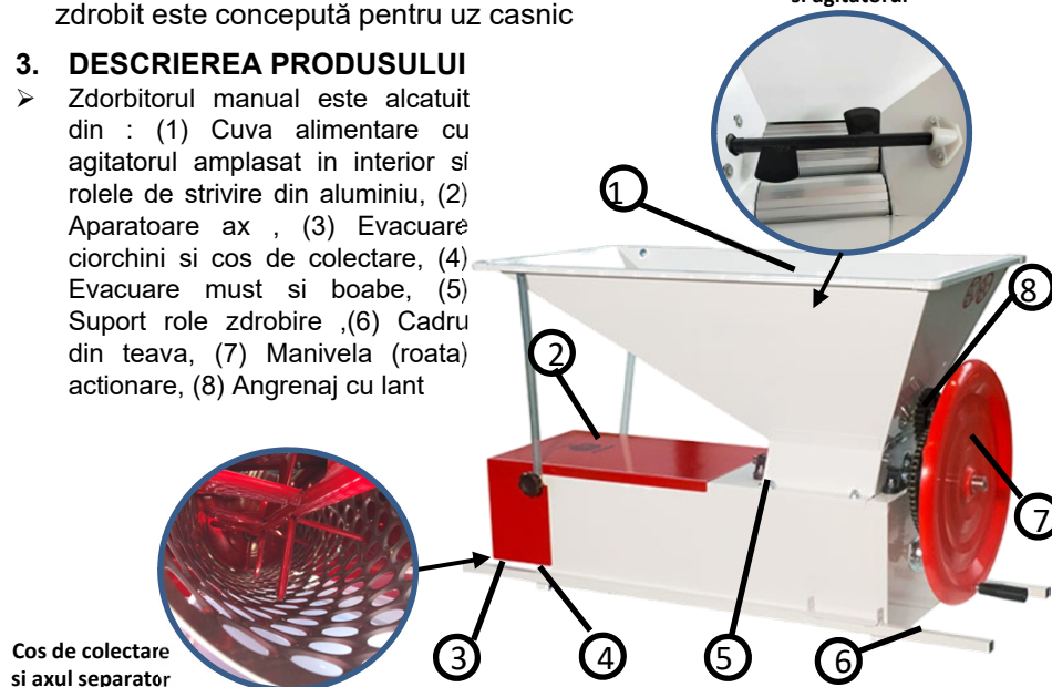
Cos de colectare și axul separator